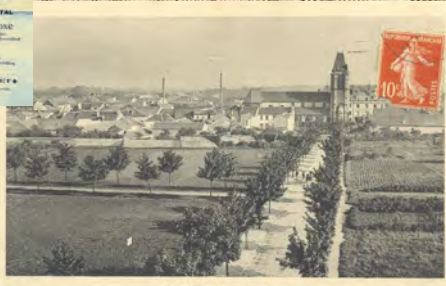
St. VILLEJUIF - Vue Générale

Sur inscription, dans la limite des places disponibles (8 personnes maximum).